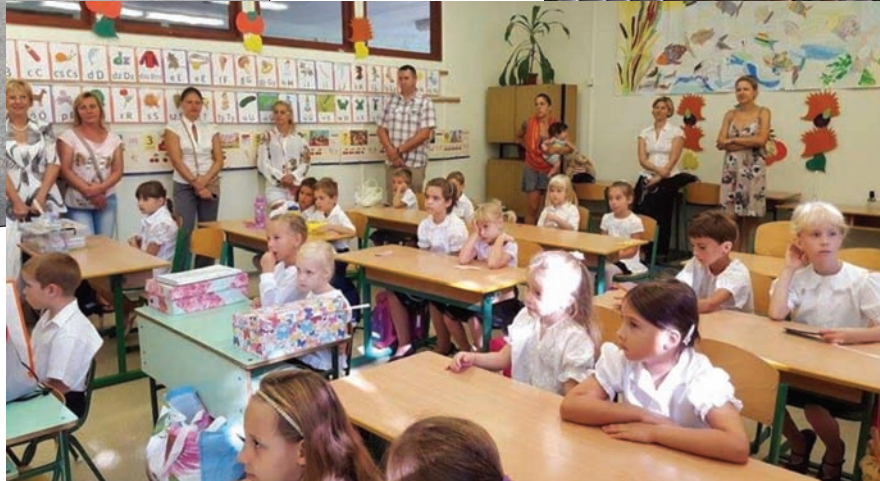
Első nap az iskolában