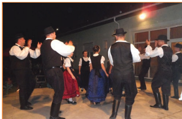
A Kiskunlacházi Kiskun Néptánc Együttes