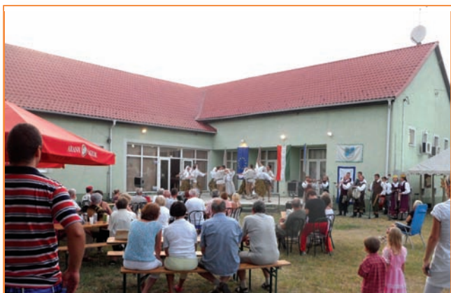
Közönség és a táncosok