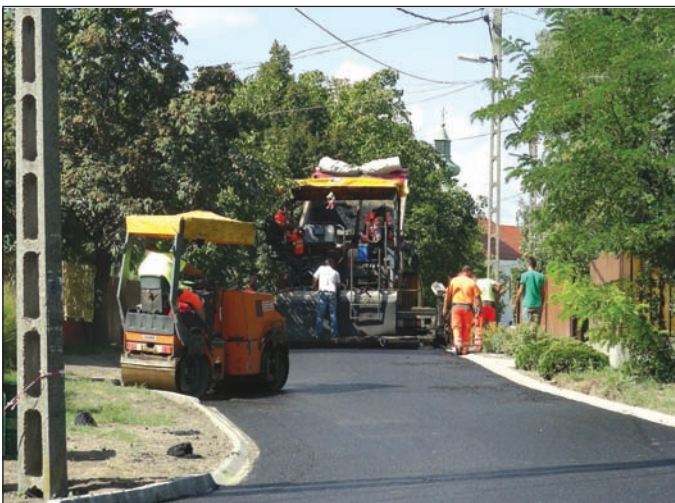
Duna utca felújítása