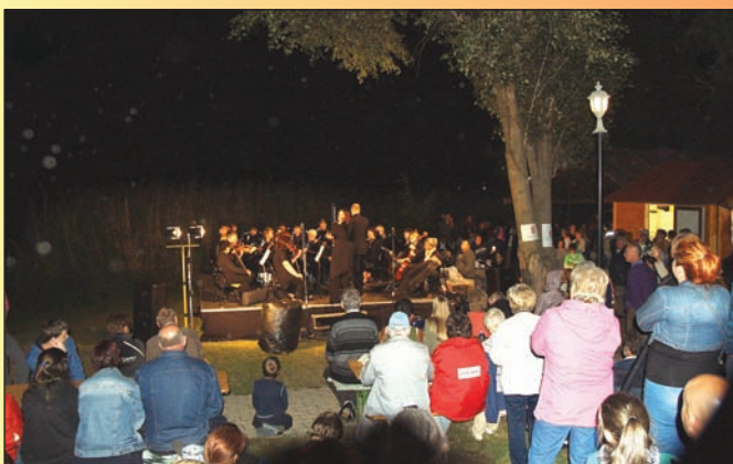
Monarchia Szimfonikus Zenekar