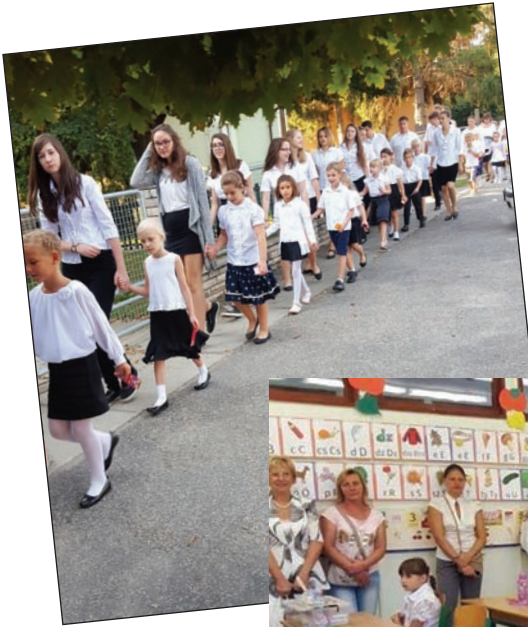
Útban az iskolába. Új elsőseink a nyolcadikosokkal